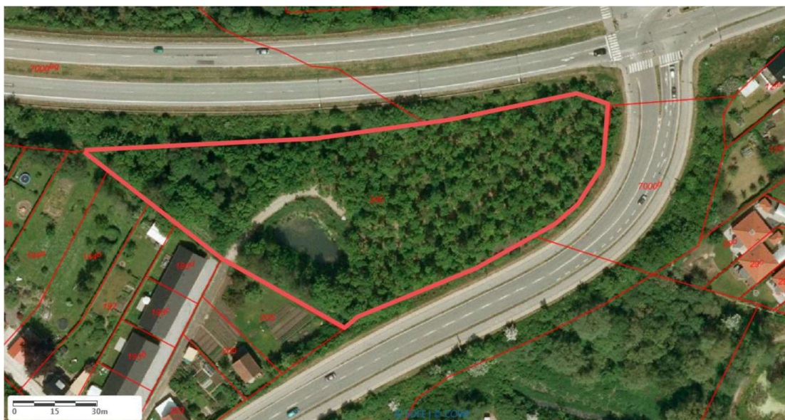
Figur 4: Område 1 er markeret med rød streg. Danmarks Miljøportal.

På luftfoto nedenfor ses området markeret.