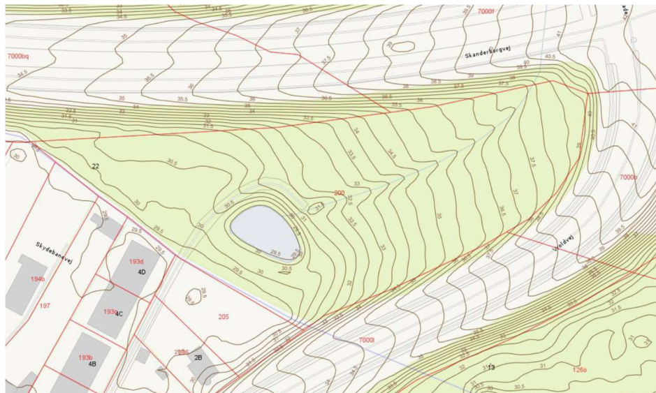
Figur 5: Kotekort for sydlige område af etape 1. Skanderborg Kommune Webkort.

Området omkring bassinet ligger i niveau med boligområdet mod vest. Mod øst stiger terrænet med ca. 10 meter. Se nedenstående kort med angivelse af koter.