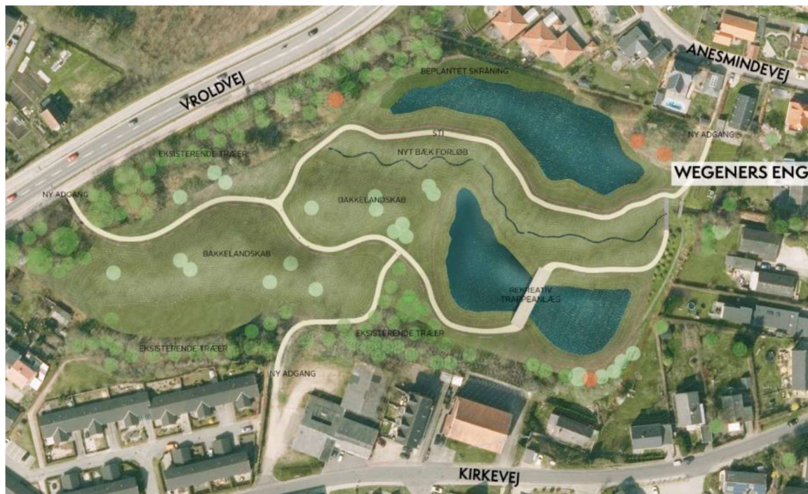
Figur 10: Principskitse for fremtidig anvendelse af arealet.

Den fremtidige indretning af området ses i nedenstående principskitse.