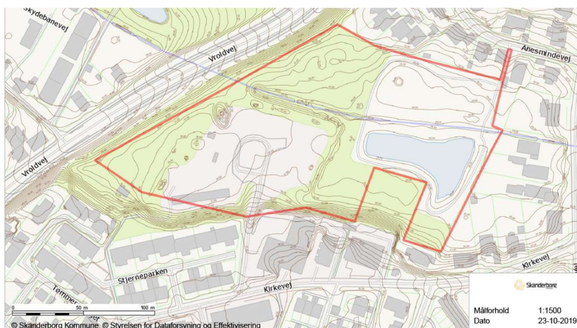
Figur 8: Lokalplanområdet markeret med rød strek. Koter er angivet med brune streger. Skanderborg Kommune Webkort.

Se nedenstående kort med angivelse af koter.