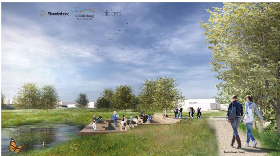
Figur 14: Illustration af Oasen. Labland.

Biodiversiteten giver mange bløde værdier, som har vist sig at være afgørende for menneskets velbefindende – grønne områder, landskaber og natur, hvor vi kan 'koble af' fra en travl hverdag og blive beriget ved tæt kontakt med naturens mangfoldighed.