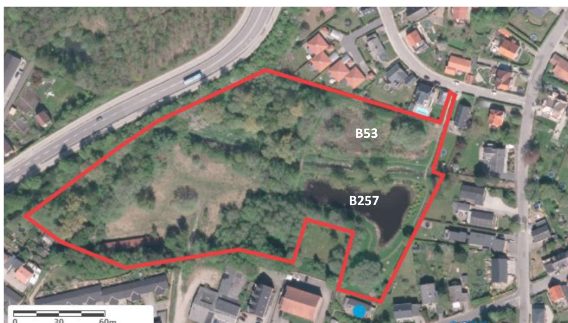
Figur 7: Lokalplanområdet markeret med rød streg. Danmarks Miljøportal.

På sydsiden af Skanderupbækken er der på nuværende tidspunkt et bassin med permanent vandspejl (bassin B257), og lige nord for bækken er der et tørbassin (bassin B53). Området er lokalplanlagt. Bassinerne ses på nedenstående luftfoto.