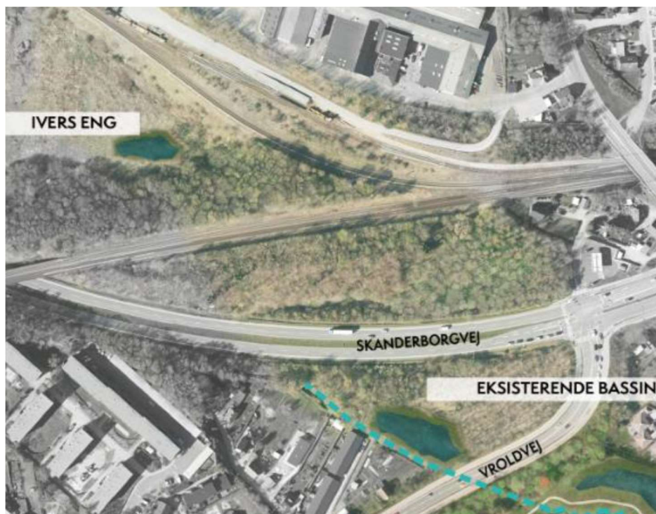
Figur 6: Fremtidige bassiner i etape 1.

De fremtidige planer for placering af bassiner i etape 1 ses i nedenstående figur.