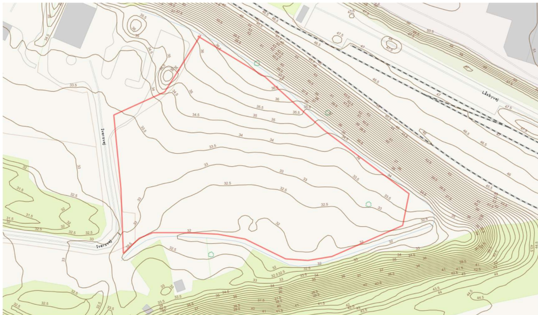
Figur 3: Kotekort for nordlige område af etape 1. Skanderborg Kommune Webkort.

Der etableres et nyt bassin (B57) i dette område. Se 'Ivers Eng' på figur 6 for skitse af nyt bassin.