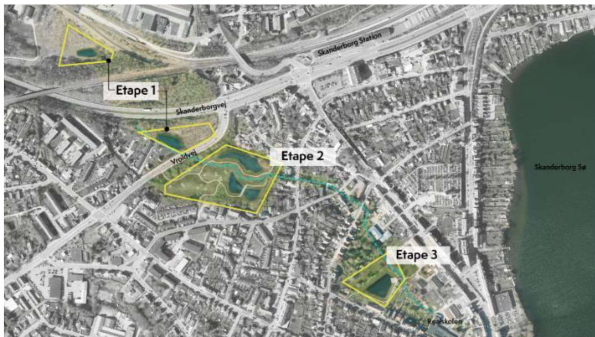
Figur 1: Projektområder for etablering af bassiner og angivelse af etaper.

Som en del af løsningen til håndtering af de øgede vandmængder er der udpeget fire områder til udvidelse af eksisterende og etablering af nye regnvandsbassiner på vandløbsstrækningen.