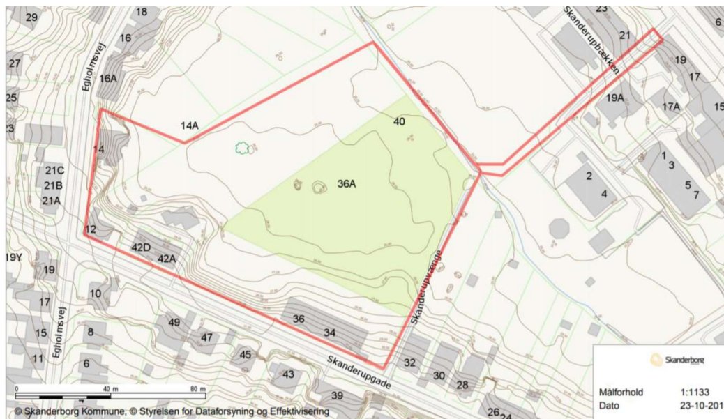
Figur 12: Lokalplanområder markeret med rød streg. Koter angivet med brun streg. Skanderborg Kommune Webkort.

I projektet vil der blive etableret et regnvandsbassin i lokalplanområdets østlige del og nogle stiforbindelser gennem området fra Skanderupgade mod Banegårdsvej. Stierne vil ligge i kote ca. 26-27 – dvs. ca. samme niveau som på nuværende tidspunkt.