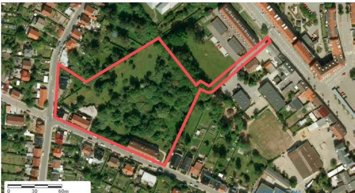
Figur 11: Lokalplanområdet markeret med orange streg. Danmarks Miljøportal.

På nedenstående luftfoto ses lokalplanområdet markeret.