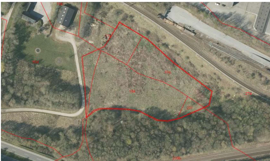
Figur 2: Skitse af område. Skanderborg Kommune Webkort.

På luftfoto nedenfor er området skitseret.